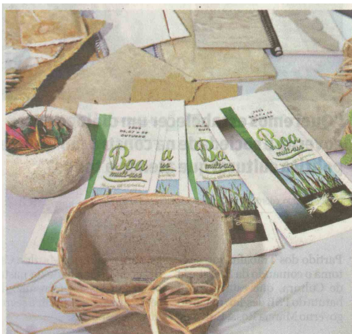
Material de escritório foi todo feito com fibra de planta de mangue